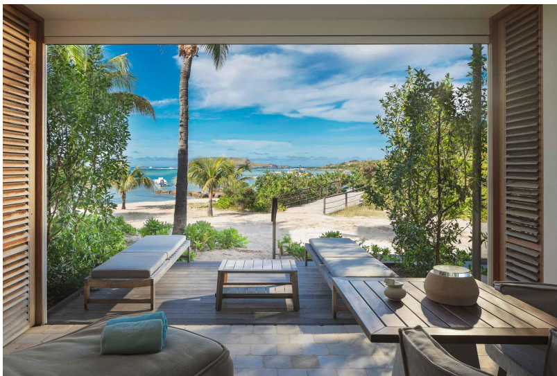
Les plus beaux hôtels spa de Saint-Barthélemy

Situé sur l'Anse de Grand Cul-de-Sac, Le Barthélemy Hotel & Spa est quelque peu éloigné du centre festif de l'île et offre à ses visiteurs une précieuse parenthèse de sérénité. Joyau d'architecture imaginé par la designeuse Sybille de Margerie, cet hôtel spa à Saint-Barth est un havre de quiétude et de raffinement. Un luxe en toute simplicité et en toute discrétion qui embrasse sans phare les codes et l'art de vivre locaux. Ici, tout est ouvert sur un lagon turquoise et une plage de sable blanc, les 44 chambres et suites sont pensées comme les « cases à vent » signature de Saint Barthélemy et le « Sand Dollar », coquillage sacré de l'île, orne élégamment le fond de la piscine à débordement de ce 5 étoiles.