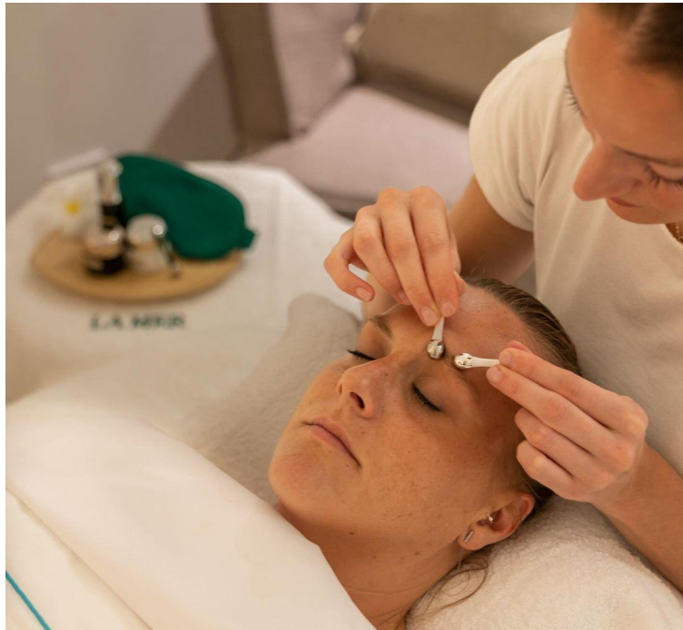
Le Barthélemy Hôtel

Le spa propose également des soins Thalion ainsi que des soins harmonisants qui utilisent le pouvoir du son et des ondes.